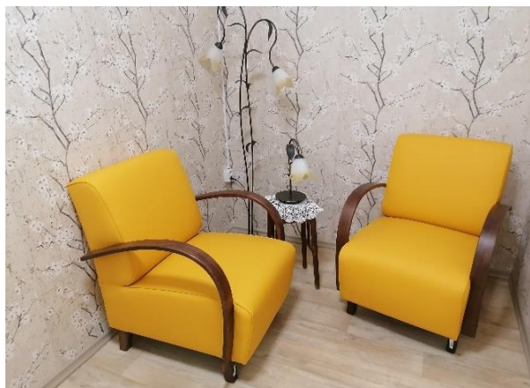
Obr. č.20–21: Odpočinkový kout v předpokoji, chodba Domova se zvláštním režimem