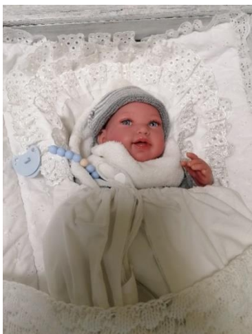
Obr.36-38: Panenka Reborn, sezónní výsadba mobilní zahrádky, práce s virtuální realitou