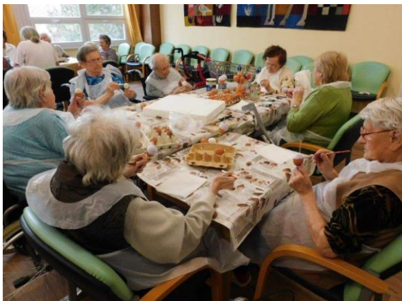
Obr. č. 49: Společná příprava Velikonoc