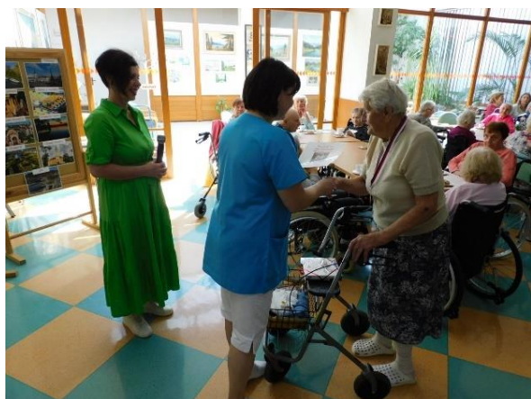
Obr. č. 30: Závěrečné ocenění cyklistů