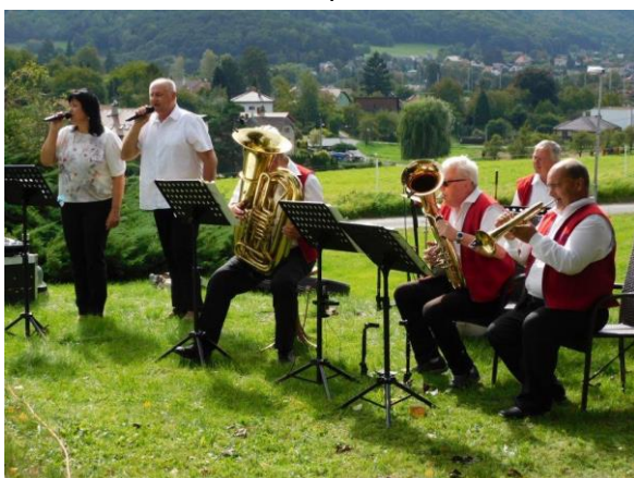
Obr. č. 58: Záhorská kapela