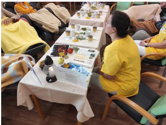
Obr. č. 34-35: Ukázky smyslové aktivizace a míčkování

V rámci smyslové aktivizace se pracovníci snažili lidem přiblížit běžné činnosti a pocity, které si většina běžné populace ani nepředstaví, jak mohou být osobám s pohybovým nebo smyslovým hendikepem vzácné.