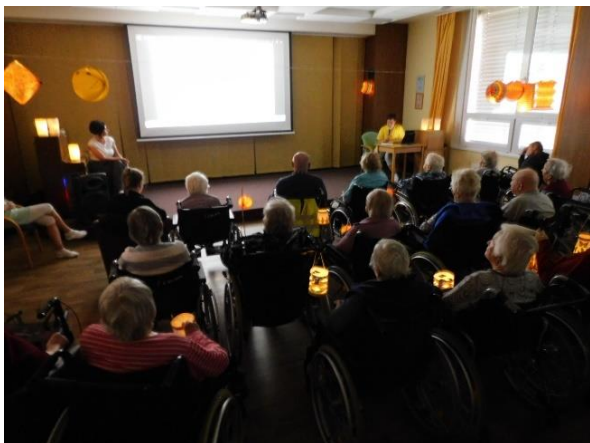
Obr. č. 66: Lampionový průvod