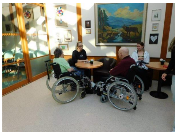
Obr. č. 9-10: Tvoření se studenty SOŠ Hranice