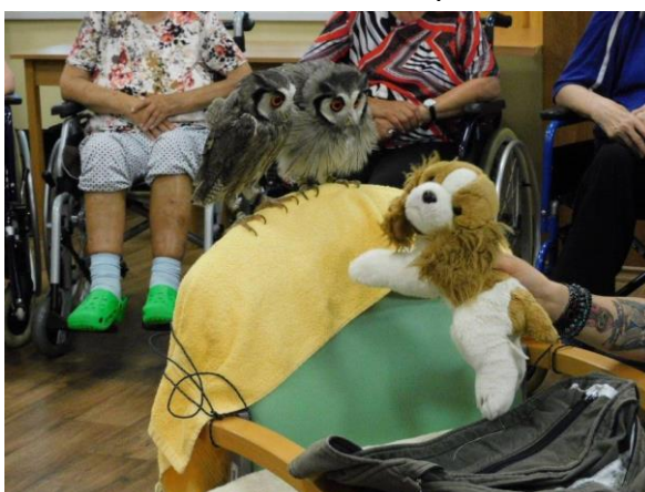
Obr. č. 60 - 61: Cvičené sovičky

Poprvé Domov navštívily dvě ochočené sovičky. Kromě zajímavých informací o jejich chovu v panelákovém bytě si je mohli senioři pohladit, nebo se s nimi vyfotit.