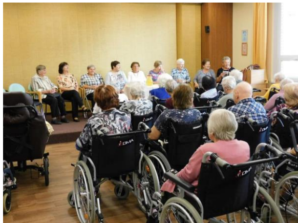
Obr. č. 15.: Zpívání s Klubem seniorů