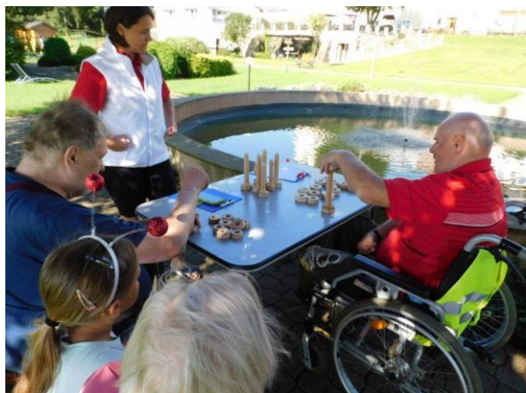
Obr. č. 62-63: Sportovní olympiáda v Domově seniorů Radkova Lhota a v Pavlovicích