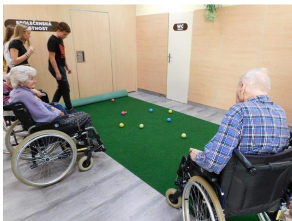
Obr. č. 7–8: Společné setkání s žáky 9. tříd ZŠ Struhlovsko