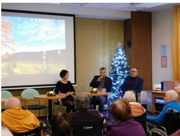
Obr. č. 74: Beseda s vedením města Hranice