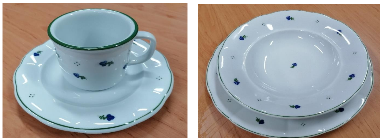
Obr. č. 26-27: Jídelní souprava DZR

Uživatelé se stravují ve svých pokojích nebo mohou využívat společné jídelny, kuchyňky nebo respiria, které se nacházejí v každém ubytovacím poschodí.