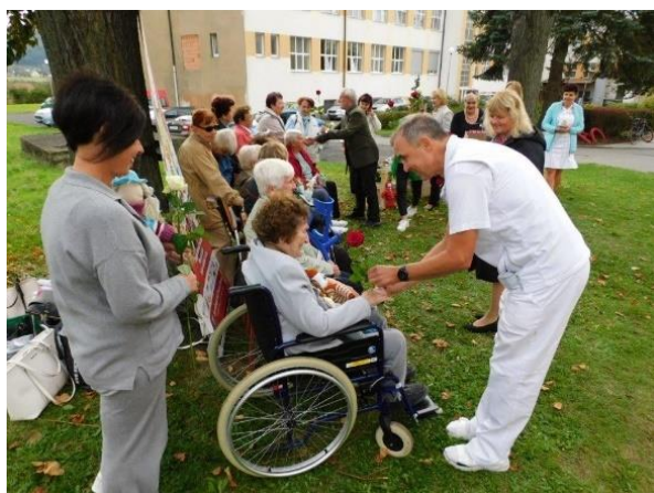
Obr. č. 13-14: Předání terapeutických panenek v nemocnici, vánoční posezení v Domově

Senioři nejen přijímají, ale také podle svých možností dávají. Na podzim i v závěru roku se obyvatelky Domova vyrábějící terapeutické panenky setkaly s vedením Klubu Panenka. Za jejich celoroční přízeň a tvorbu byly obdarovány květinou a drobnými dárky. Podzimní setkání se odehrálo v areálu hranické nemocnice. Prosincové pak proběhlo u domovského vánočního stromku a bylo zpříjemněné posezením u krbu s dobrou kávou a cukrovím.