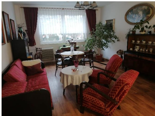
Obr. č. 24: Posezení na chodbě