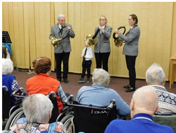
Obr. č. 67: Trubači OMS Přerov