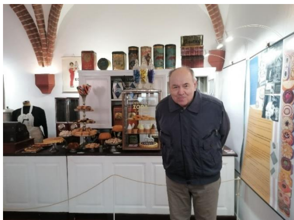
Obr. 47: Návštěva Výstavy – Historické cukrárny Obr. č. 48: Pietní akt k uctění T.G. Masaryka

Senioři navštívili výstavu na Staré radnici na téma „Historické cukrárny“ – aneb sladká romantika první republiky a po ní se přesunuli do cukrárny na náměstí, aby ochutnali současné dezerty. Účastnili se také pietního aktu uspořádaného k počtě T. G. Masaryka.