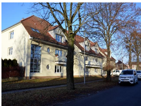
Obr. č. 80: Dům s pečovatelskou službou