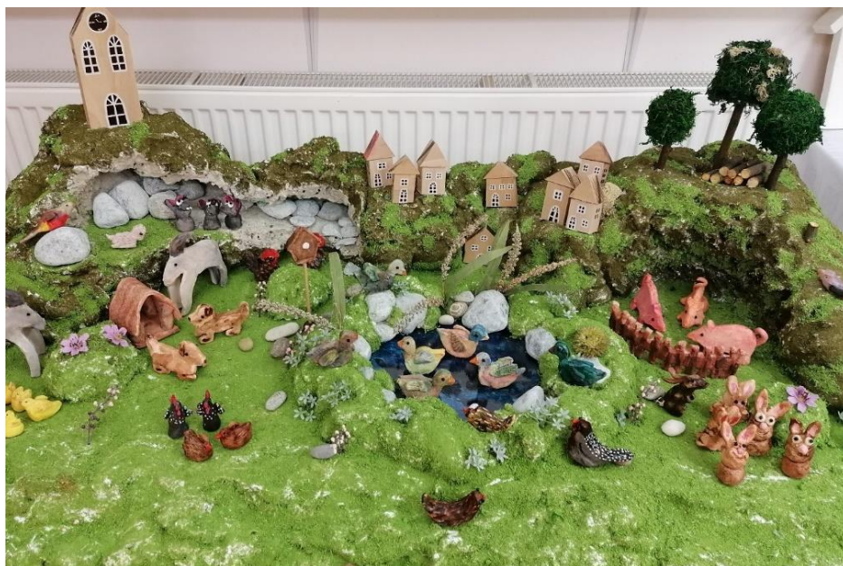
Obr. č 1.: Společné dílo uživatelů Domova pro seniory