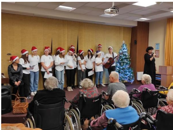
Obr. 72: Vystoupení studentů SZŠ Hranice