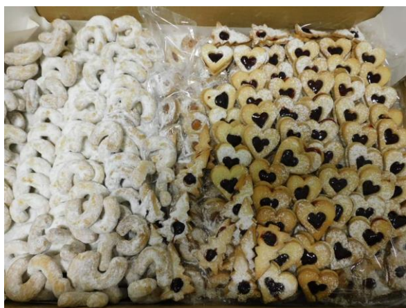
Obr. č. 11: Cukroví od Spolku žen z Partutovic Obr. č. 12: Setkání rodin, uživatelů a vedení DS