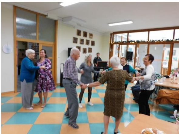
Obr. č. 68: Kateřinská zábava