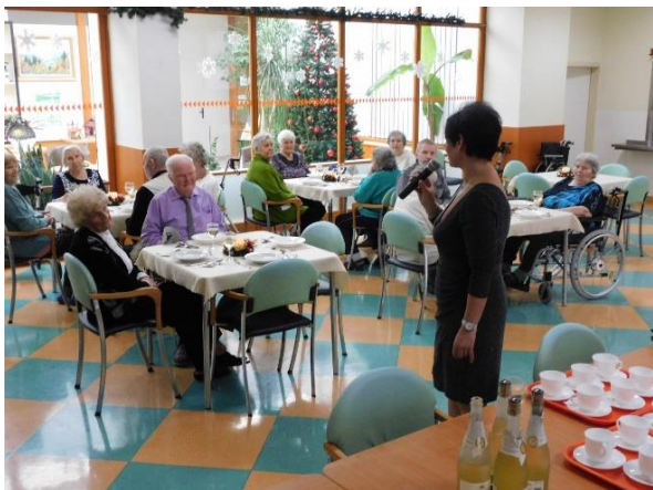
Obr. č. 76–77: Štědrovečerní oslavy