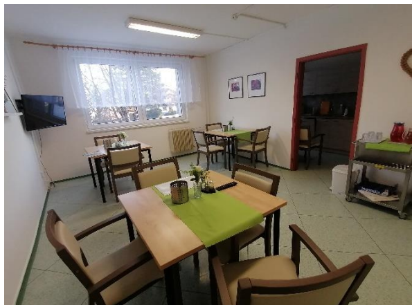
Obr. č. 28: Jídelna