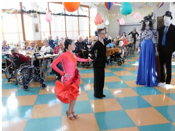
Obr. č. 45: Vystoupení taneční školy