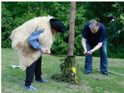
Obr. č. 51-53: Kácení máje

Mezi každoroční velké akce se řadí Kácení máje, při kterém opakovaně vystupuje Hudecká muzika, spolek tanečníků z Černotína a Hluzova s tancem Beseda a stepařky skupiny Sester Hlavinkových. Poprvé byly k vidění i k pohlazení ovečky umístěné v mobilní salaši. Kromě zástupců vedení města Hranice přijala pozvání slovenská delegace z vedení Sociálních služeb v Hlohovci.