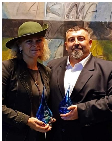
Obr. č. 6: Cena Ď